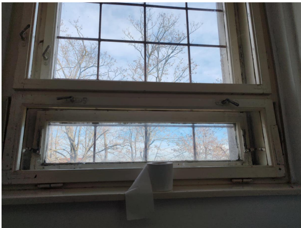
3. ábra - Hátsó öltözők és mosdók ablakai. Koszos, penészes, lepattogzott festék. Ezeket a helyiségeket használják a nálunk fellépő sztárvendégek