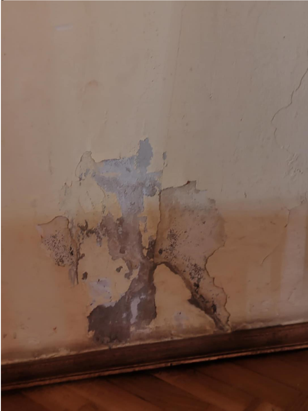
1. ábra Rögtön a nagyterem bejárata mellett levált penészes vakolat

Néhány mindenki számára feltűnő probléma: