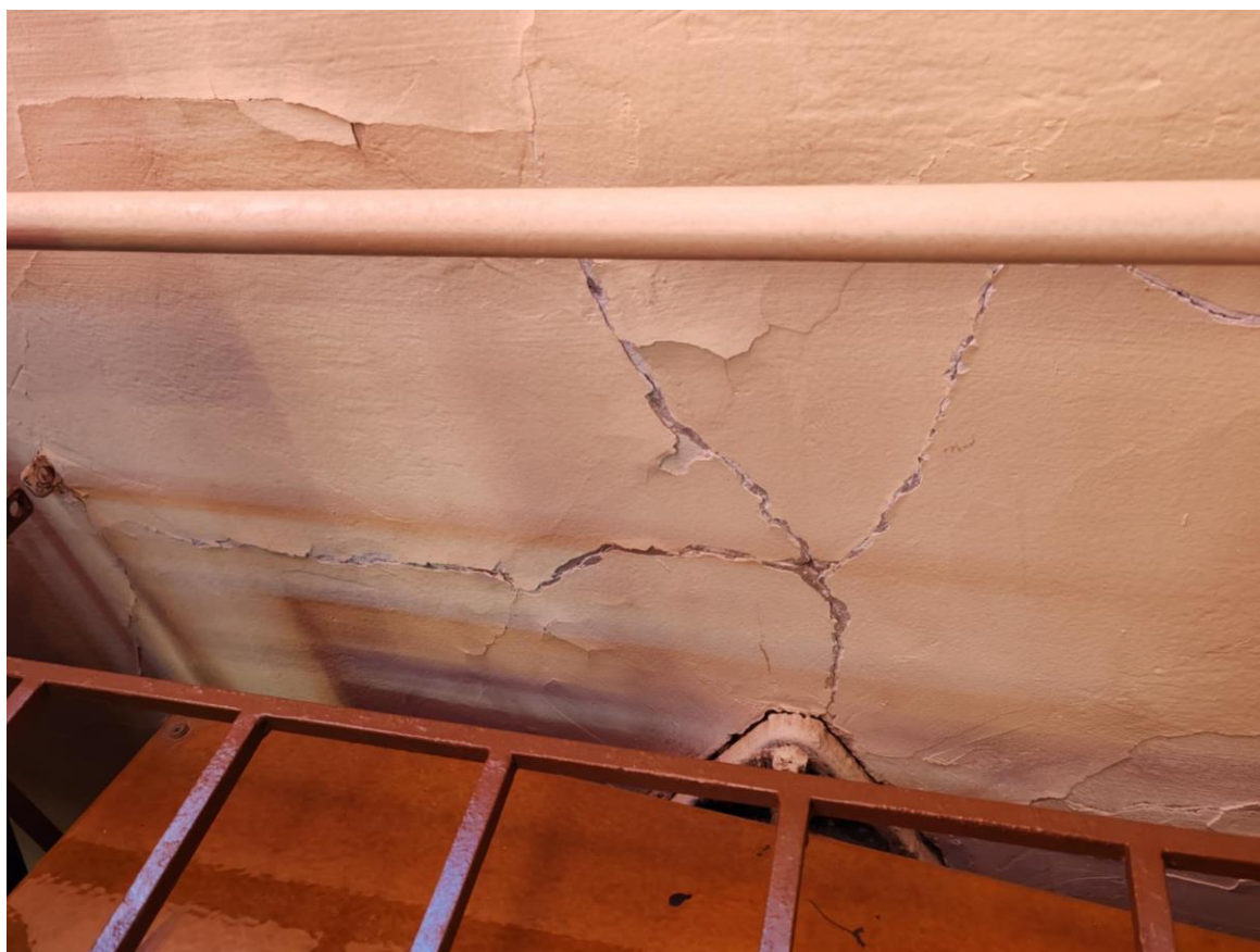
4. ábra - Nagyteremben több helyen látható a falon hasonló repedés