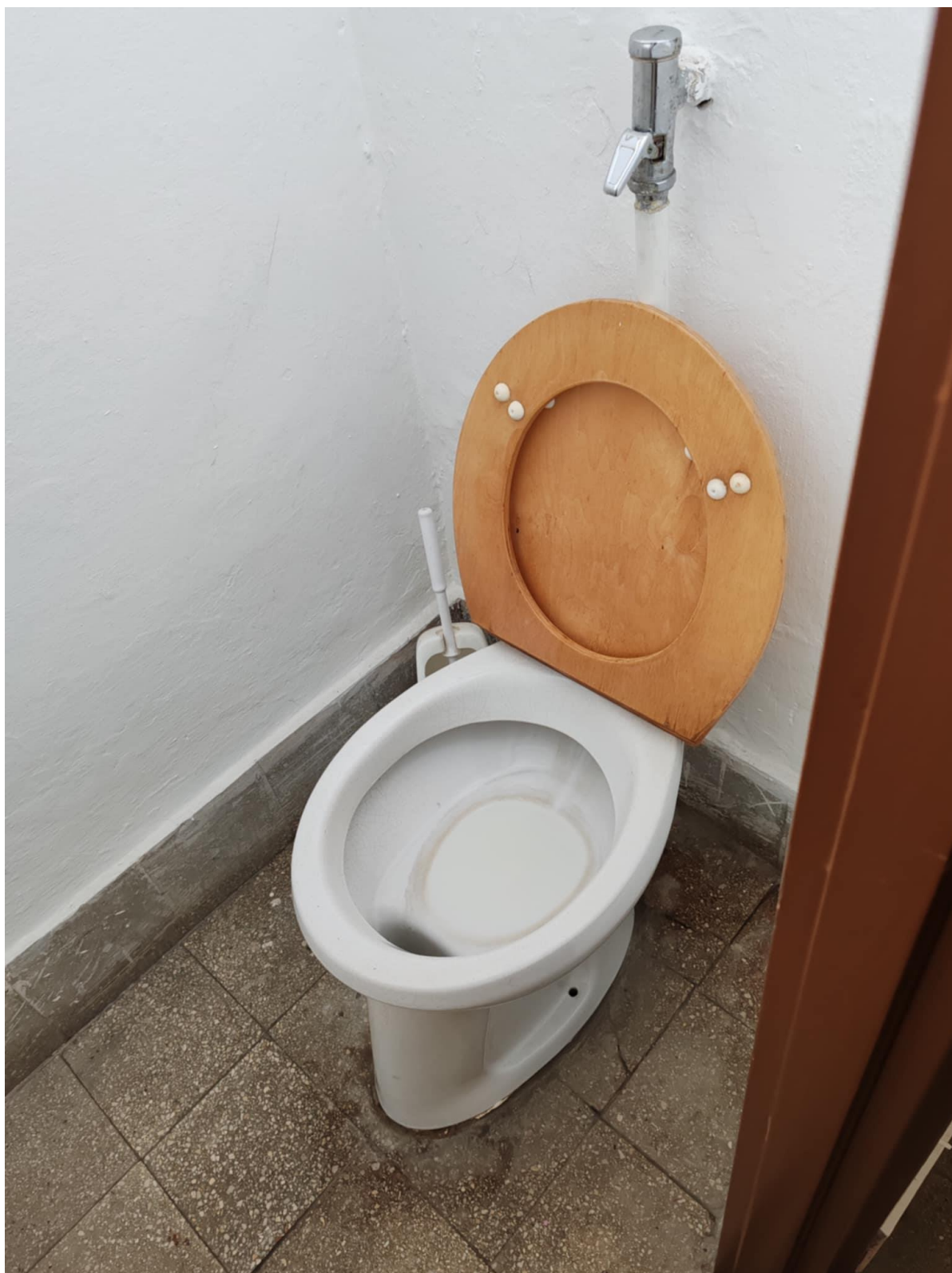
9. ábra - Művészmosdó - hideg van bent, a mosdó és wc helyiség is burkolatfelújításra szorul, szükség lenne egy elektromos hőszugárzóra, mert a nyílászárók nem szigetelnek és előadás esetén (télien, havonta több előadásra is várjuk az előadókat) a mosdó hőmérséklete 10 fok körül van.