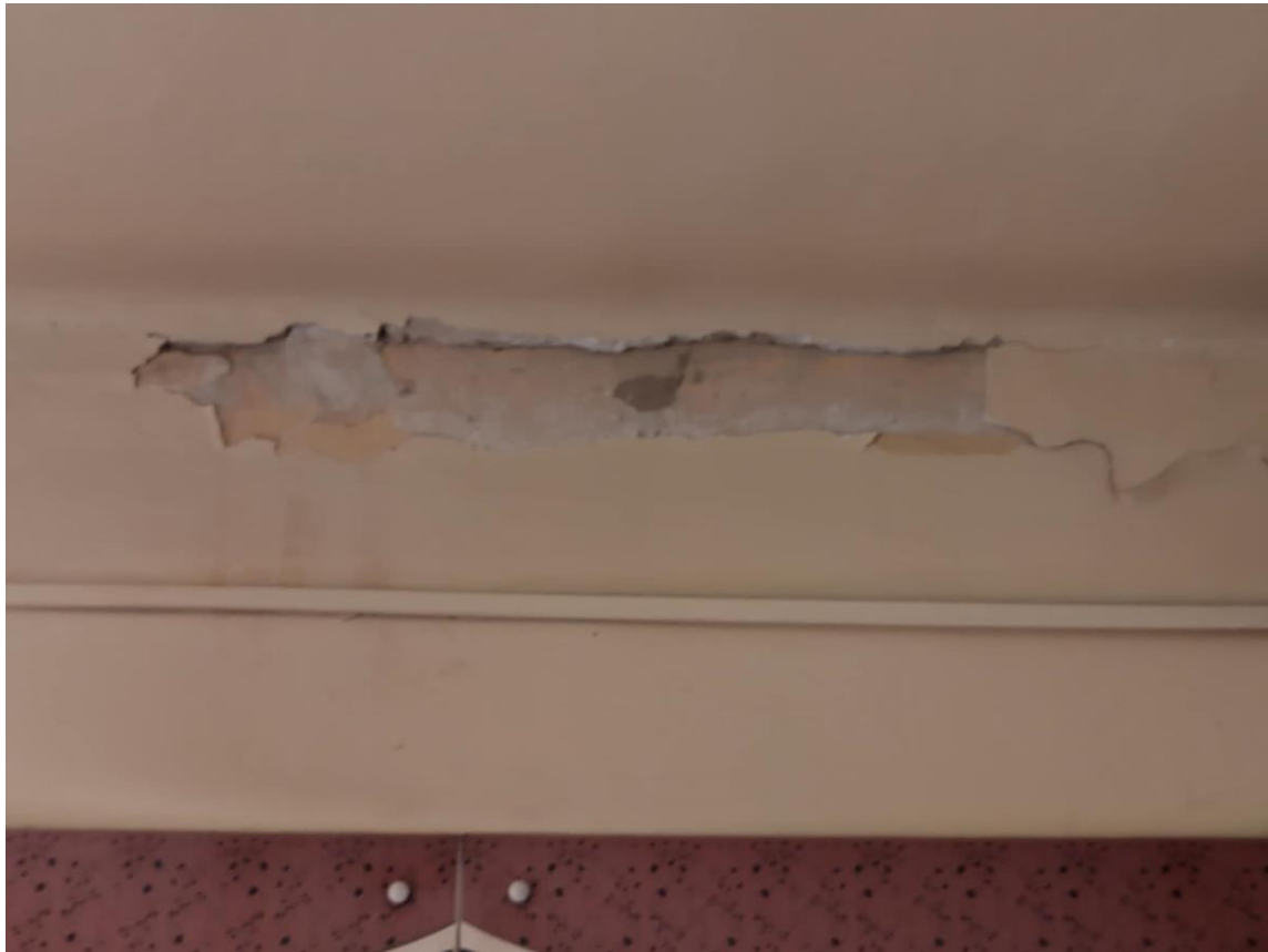
6. ábra - előtér, ahol fogadjuk a vendégeket. Nem csak a festék de a teljes vakolat lehullott