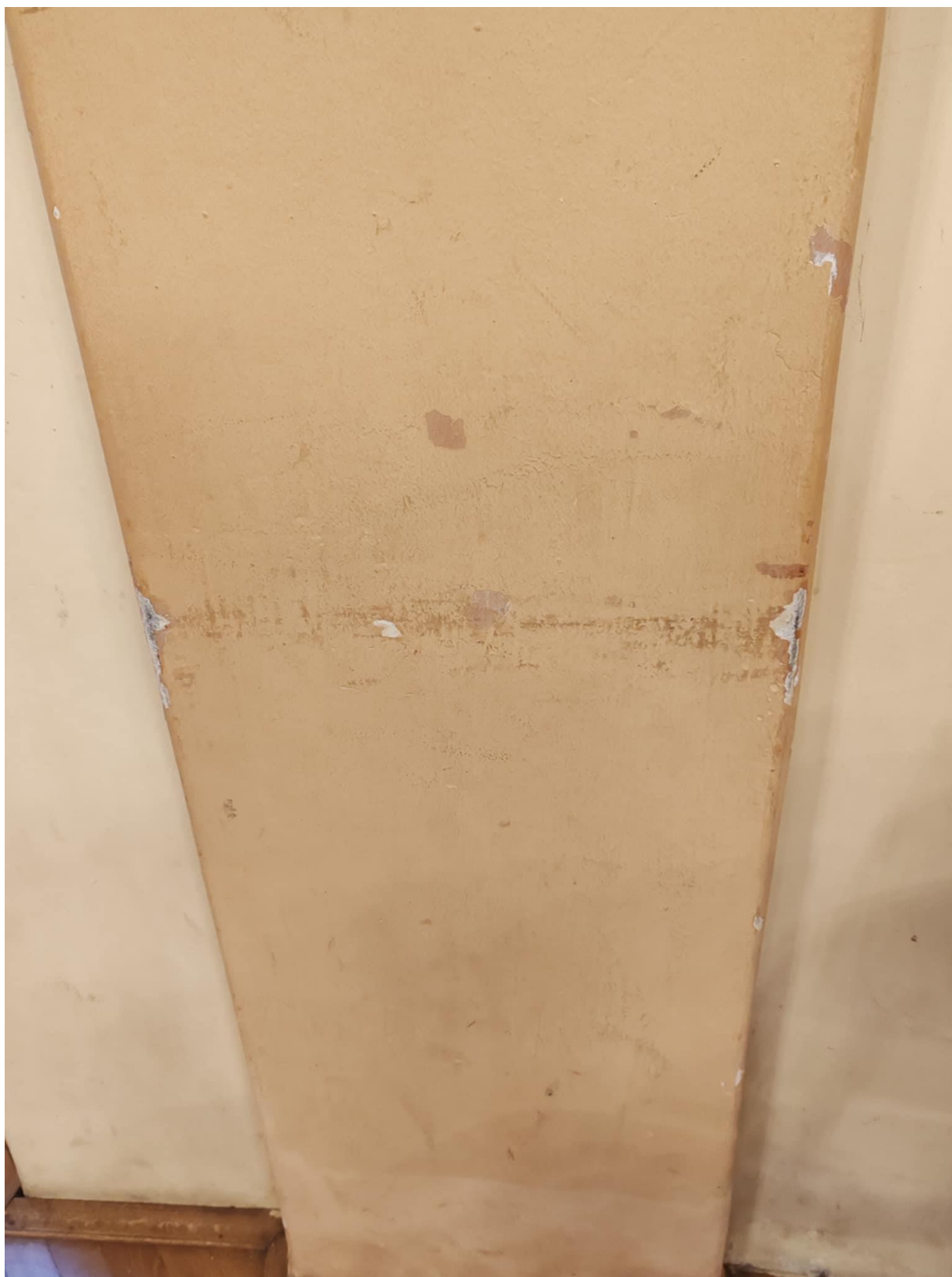
8. ábra -nagyterem mindenki számára (tehát nem tudjuk takarni) festése a két oldalajtó közötti részen