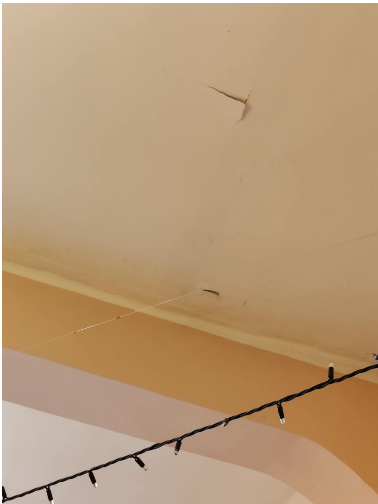
2. ábra - Nagyterem mennyezetén több helyen leváló festék