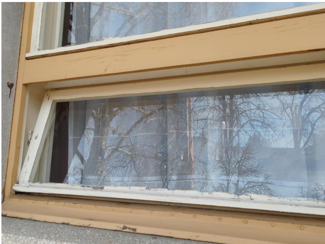
7. ábra - Kisterem ablakai - elvileg zárva, de a szél befújta a külsőt. Mivel két rétegű, így a belső zárva van. Több ablak nem nyitható, vagy nyitás után nehezen zárható, lepattogzott festék és nehezen tisztítható