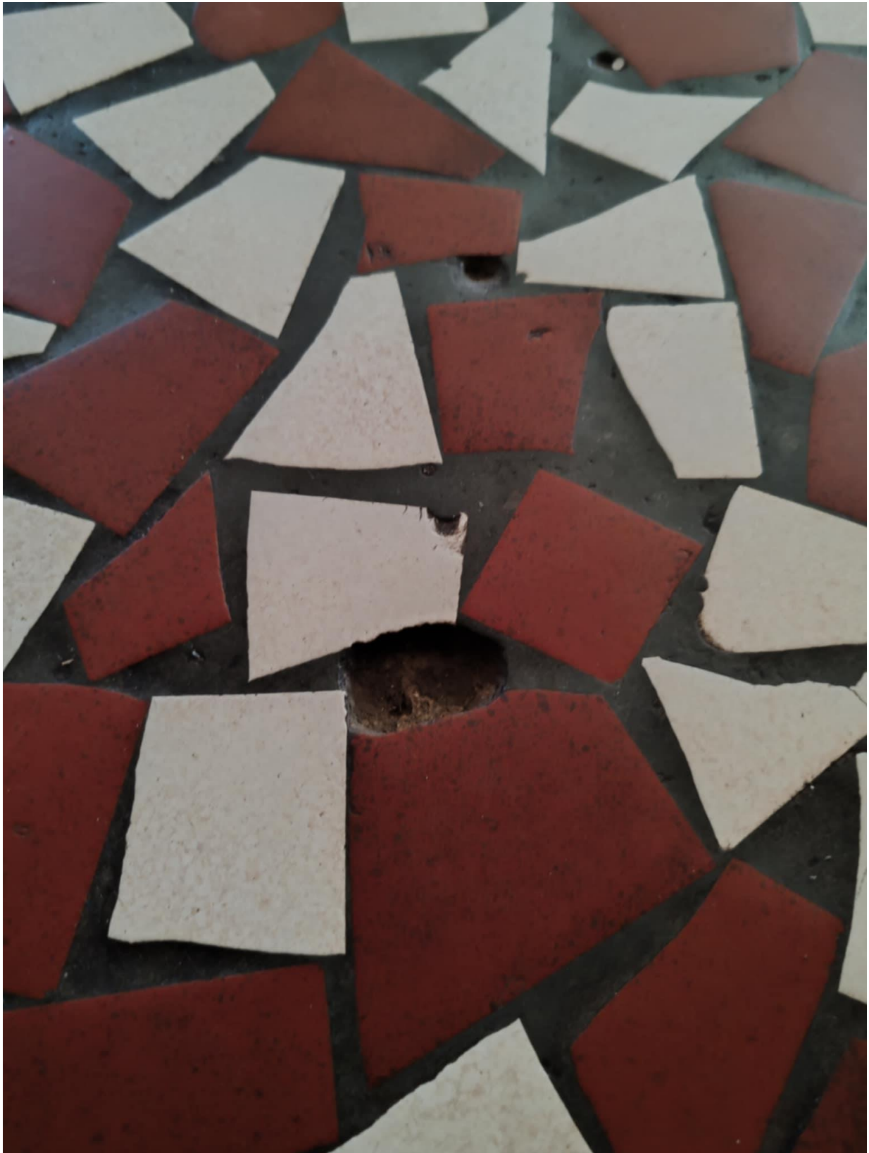
10. ábra – előtér padlóján több ilyen „lyuk” van, melybe magassarkú cipőbe belelöpve többször előfordult kisebb baleset