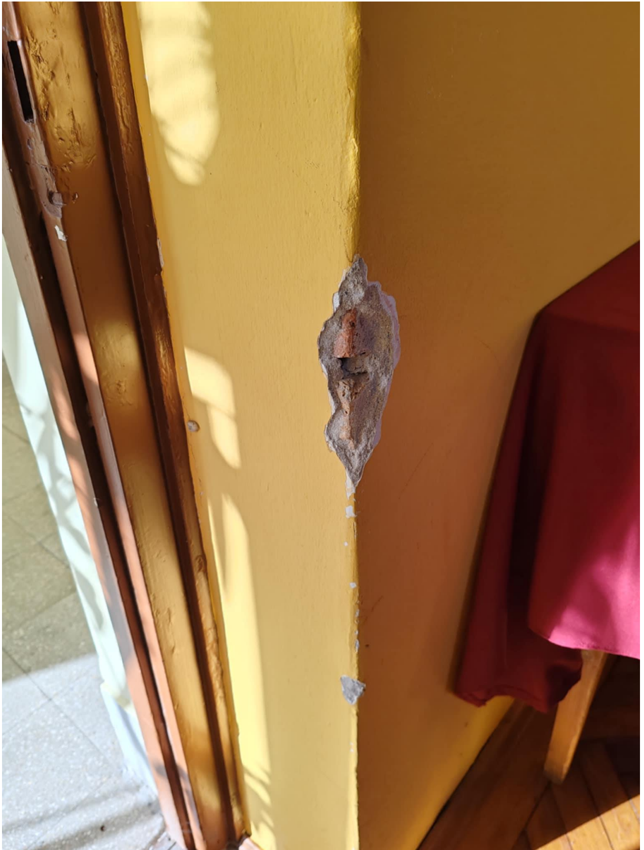
5. ábra - Művészöltöző - különös gondot jelent, hogy csak 1 vállalható művészöltözőnk van, így ha nagyobb társulat érkezik, ahol biztosítanunk kellene a külön öltözőt a férfiak és nők részére, vagy a létszám nagyobb mint 5 fő akkor már a művészek a folyosón öltöznek ahol nincs fűtés és az utcáról az ablakon keresztül belátás van.